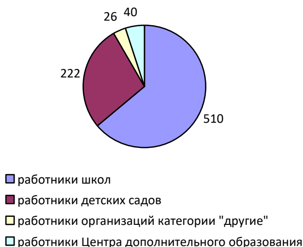
Структура районной организации Профсоюза

По состоянию на 01.01.2022 года численность работающих в организациях, в которых имеются члены Профсоюза, составила 1194 человек (без учета совместителей). На учете в Любинской районной организации Общероссийского Профсоюза образования состоит 798 членов Профсоюза, охват профсоюзным членством составляет 66,8%, что на 6,9% меньше, чем в прошлом году.