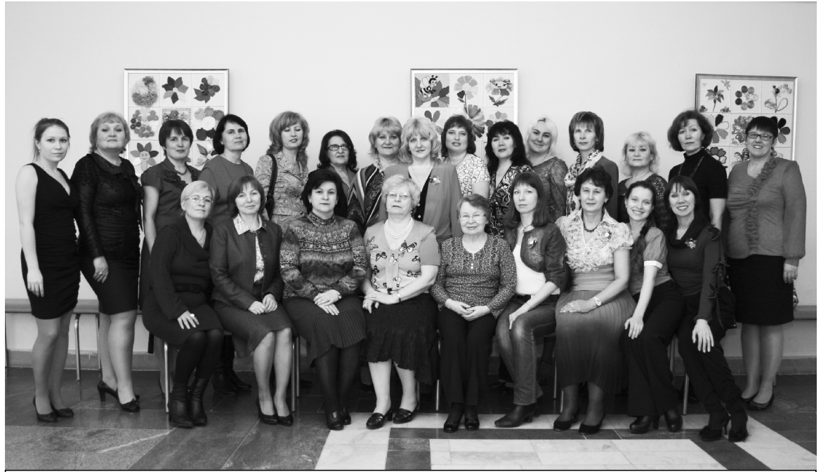
2012 г. Мастера своего дела.