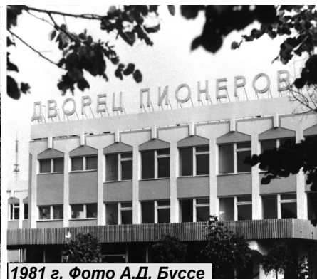
1981 г.