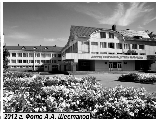
2012 г.