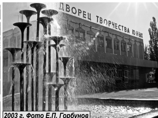
2003 г.