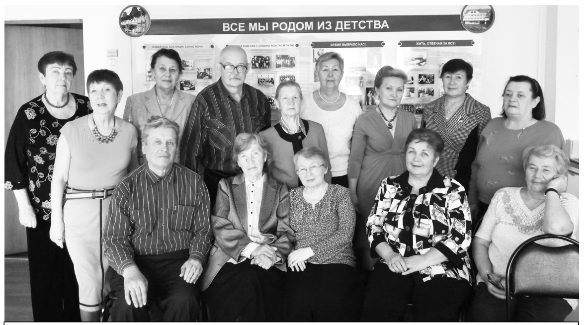
2013 г. Ветераны Дворца творчества детей и молодёжи.

С Днём рождения, любимый Дворец, с праздником, уважаемые друзья и коллеги!