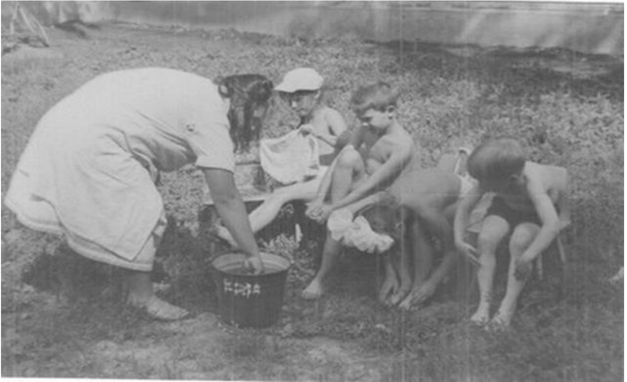
Закаливание 1950 г.