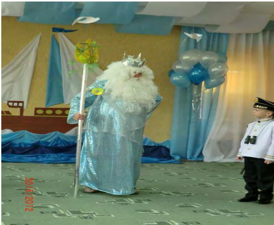
Выпускной утренник 2012 года