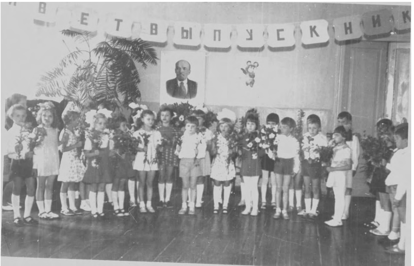
Выпускной 1967 г.