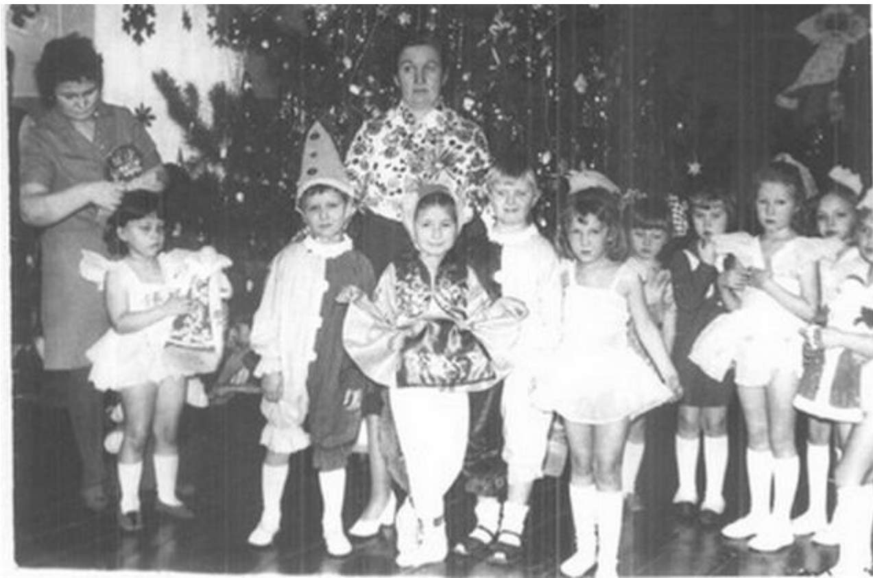
Новый год 1957 г