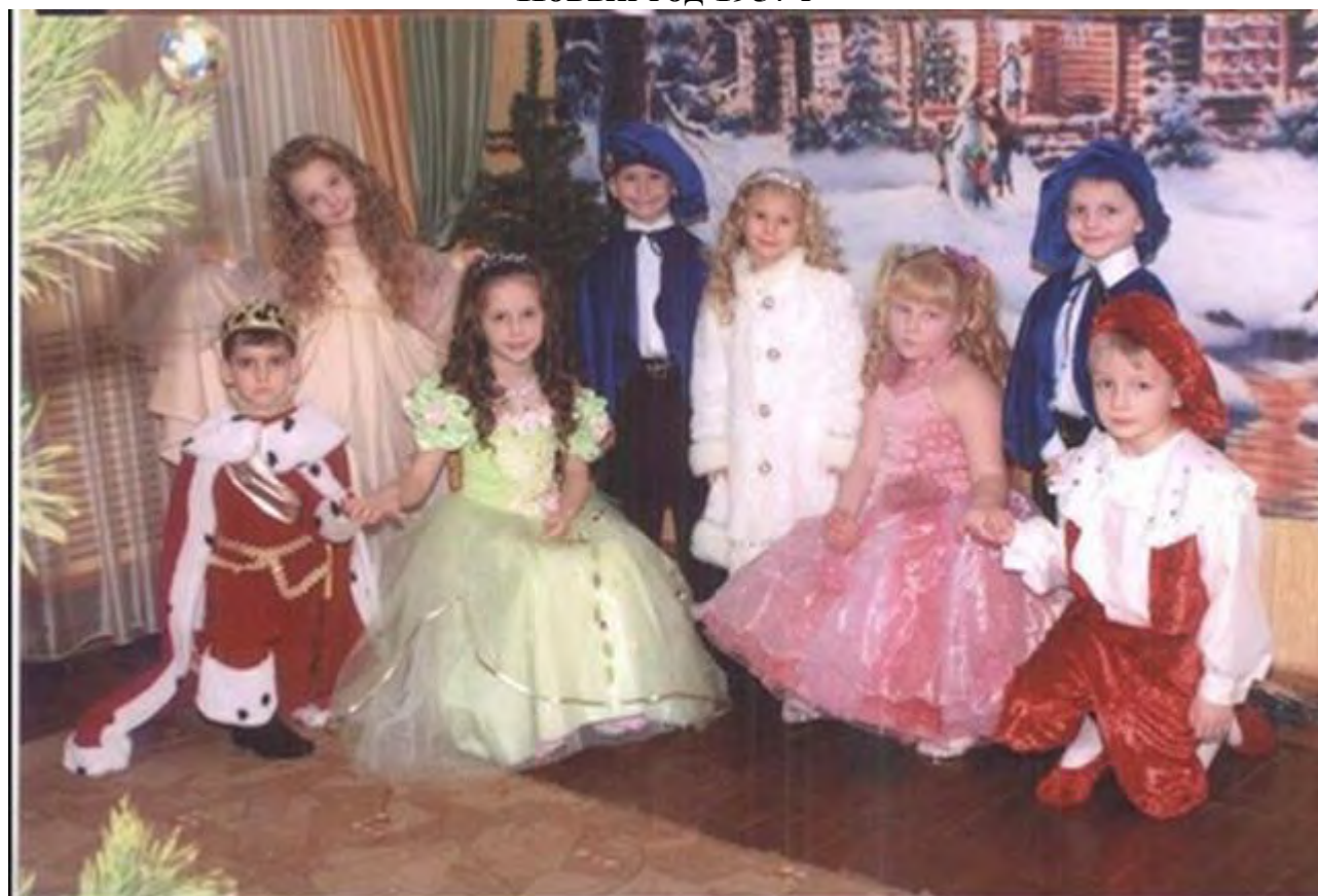
Новый год 2010г.