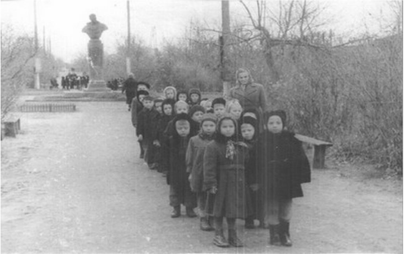
Прогулка 1950 г.