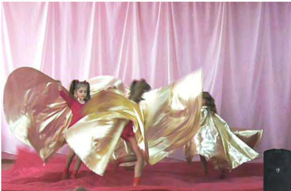
«Россия молодая» (всероссийский конкурс),