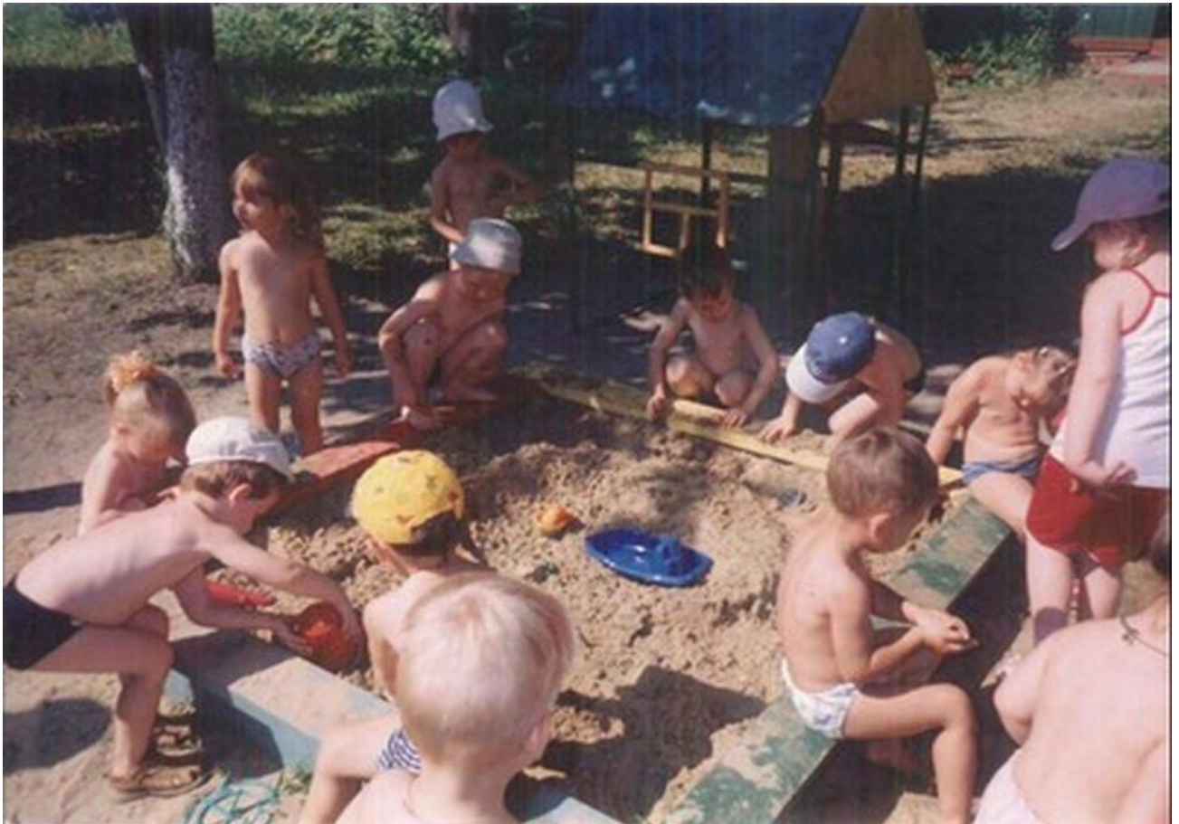
Прогулка 2010 г.