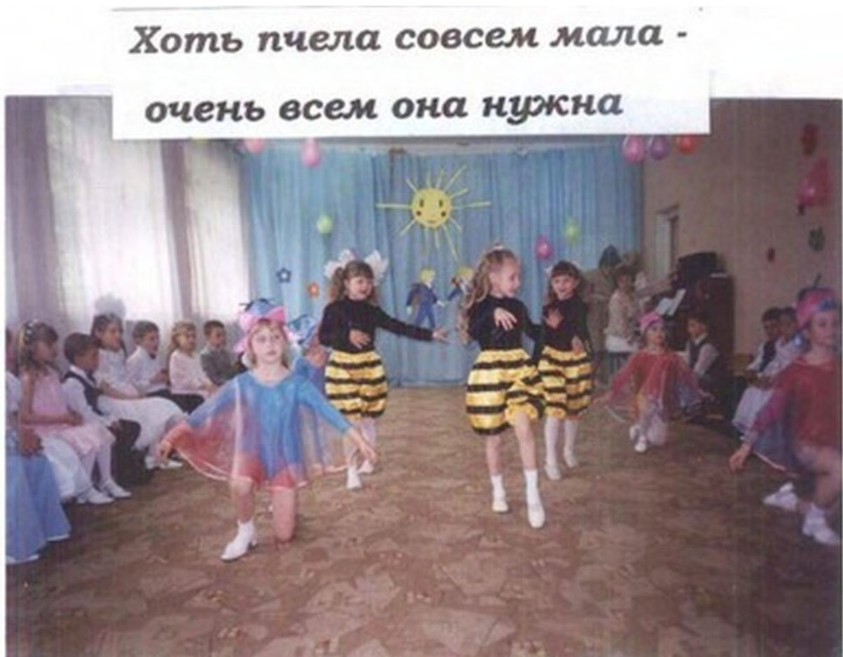
Утренник 2012 г.