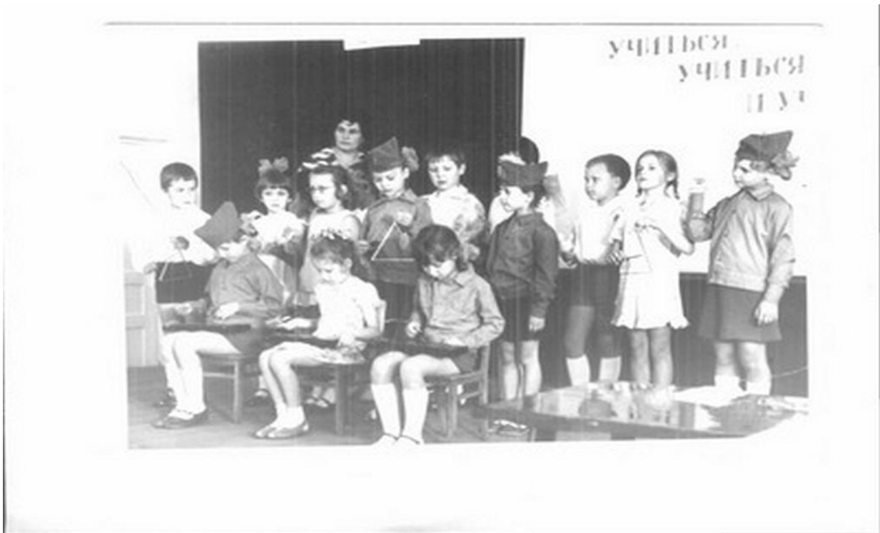
Утренник 1962 г.