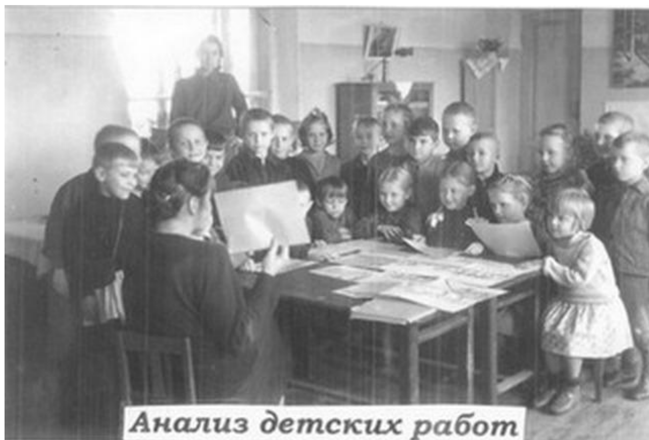
Анализ детских работ