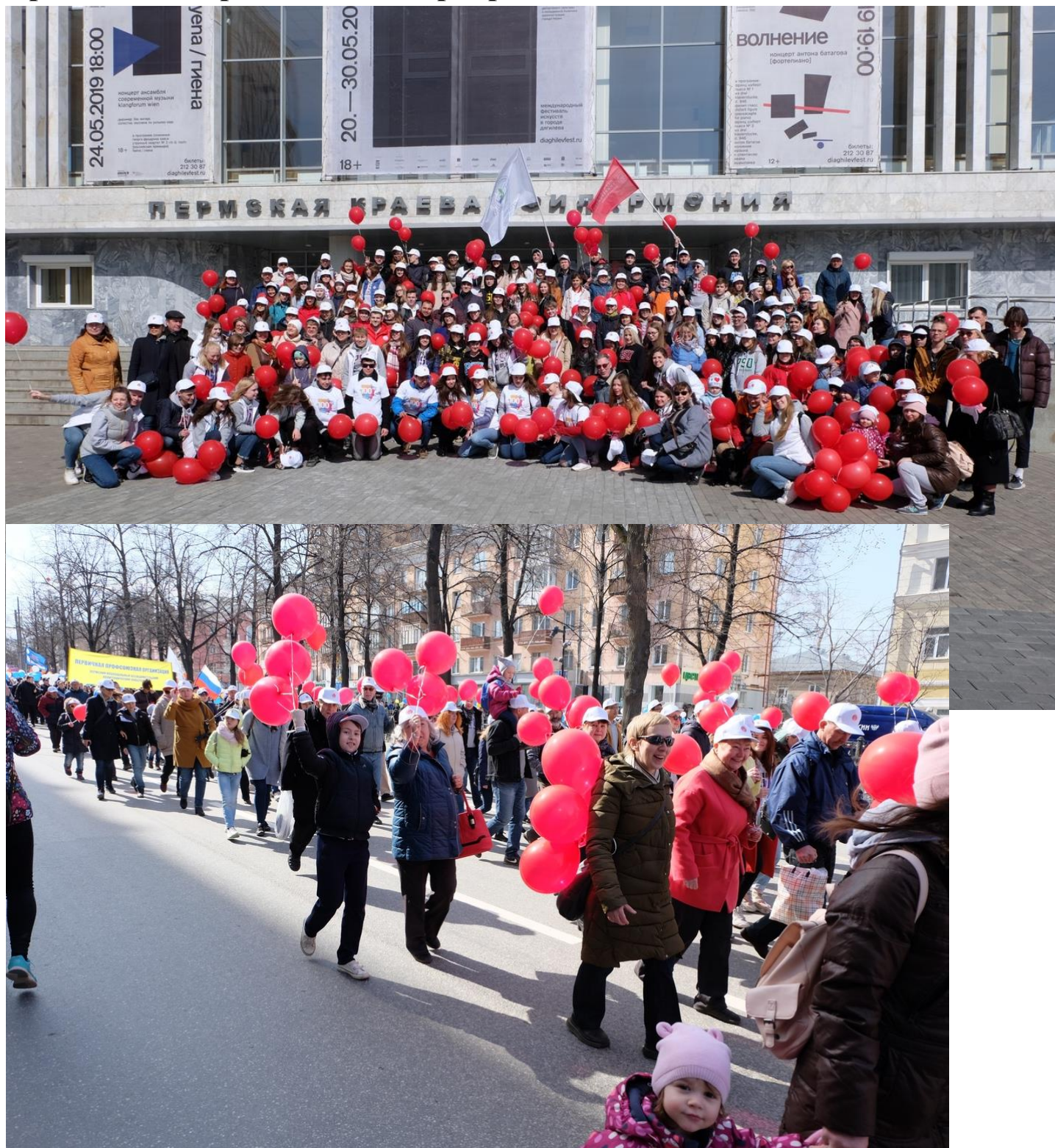
Студенты, преподаватели и сотрудники университета – участники Первомайского шествия 2019 г.