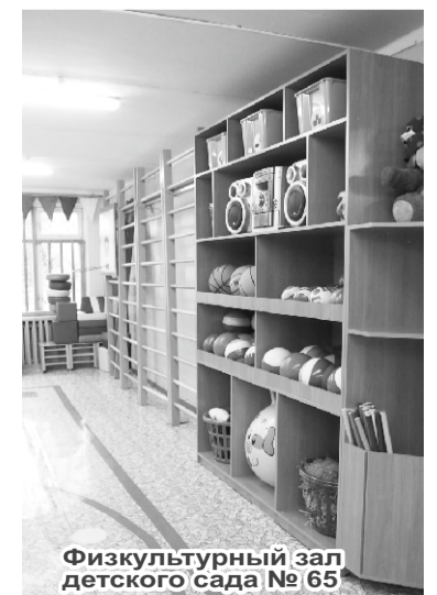
Физкультурный зал детского сада № 65