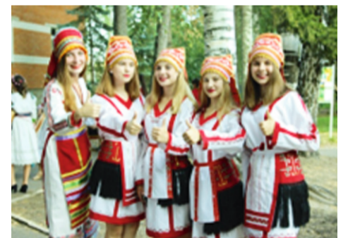
Республиканский семейный конкурс «Мой семейный архив»

Международный лагерь детей финно-угорских народов